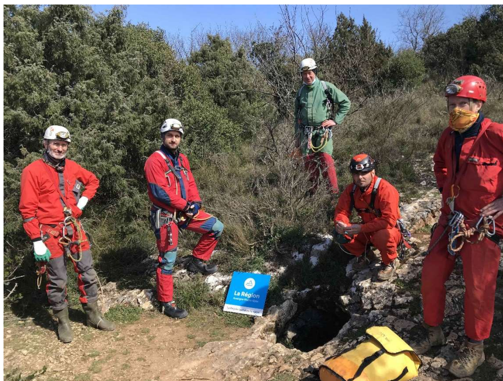
Grotte Nouvelle, entrée et P30 rive droite :