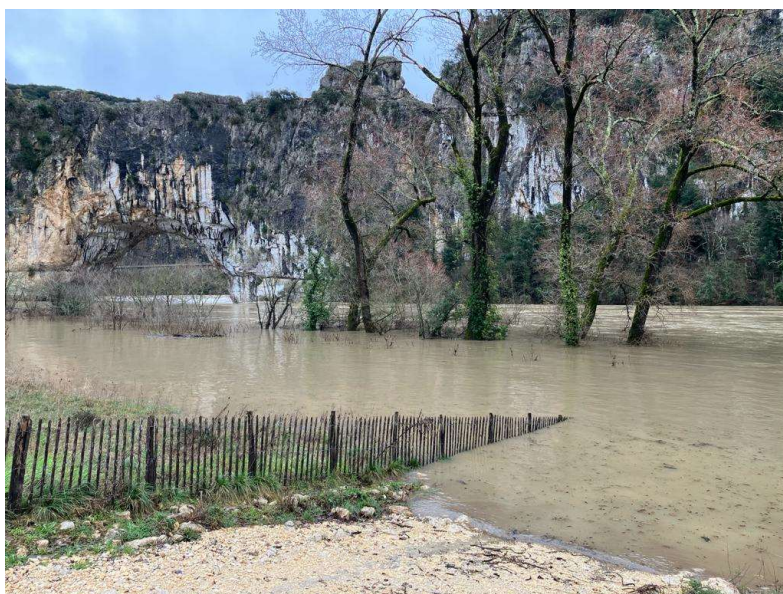
Le pont d'arc après la pluie, pas de canoés ?