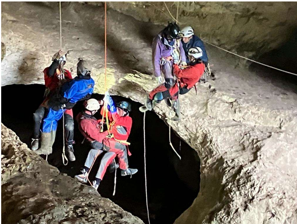
Ateliers dégagement d'équipier Baume de la Chaire