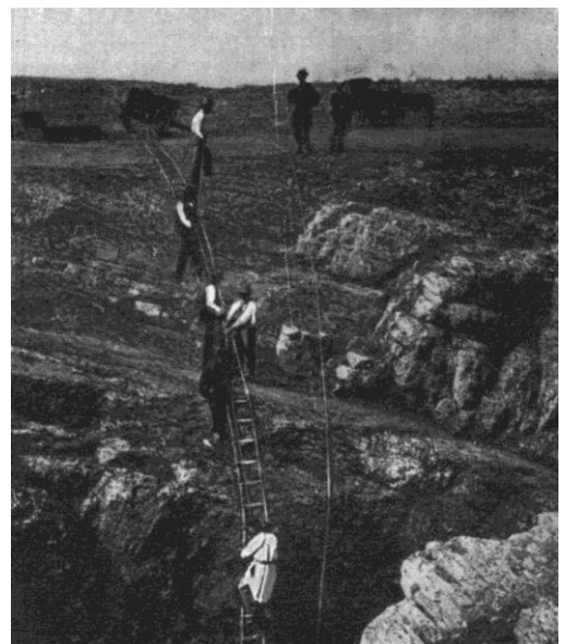
Descente aux échelles du 1 er puits